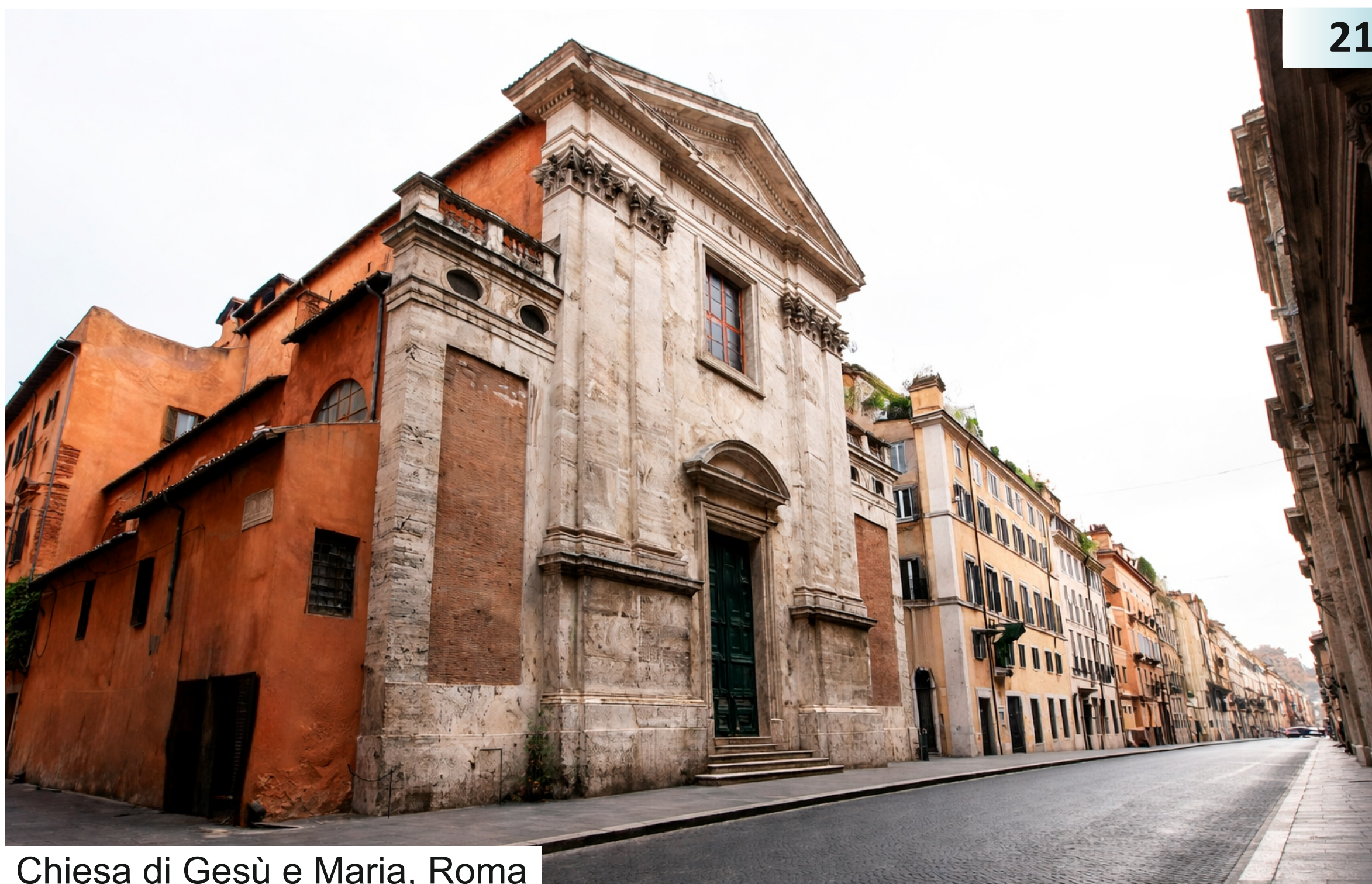
Chiesa di Gesù e Maria, Roma

verso il Divino, si genera non solo per il ricco e imponente presbiterio progettato dal Rainaldi o per l'Assunzione della Vergine della volta a botte e l'Incoronazione di Maria dell'ancòna centrale dipinte da Giacinto Brandi (4), ma anche per quei serafici angeli e angioletti che costellano l'interno, dalla controfacciata all'arco presbiteriale.